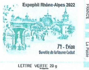
Timbre personnalisé ② Lettre verte (LV)