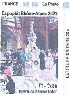
Timbre personnalisé ① Lettre prioritaire (LP)