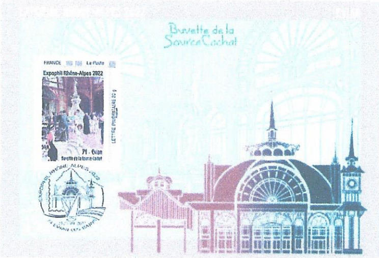
carte postale ①